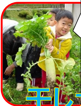
こんな大きい大根抜けたよ