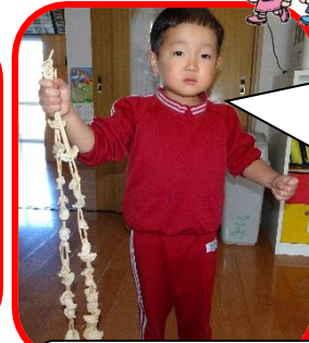
こんなに小さくなったよ