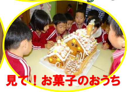
見て! お菓子のおうち