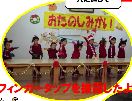
フィンガータップを披露したよ