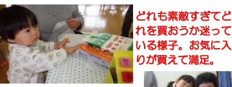
どれも素敵すぎてどれを買おうか迷っている様子。お気に入りの物が買えて満足。