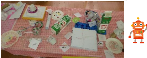
廃材を使って製作をしていた時に「これも売りたい。」と子どもたちからの提案。レストランととりっぴー店内で販売しました。大盛況でした!!